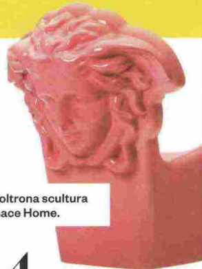
La poltrona scultura Versace Home.

L'anniversario è di quelli epocali: a ispirare la mise en scene di "Marni Moon Walk" sono i cinquant'anni dallo sbarco sulla Luna. Tra montagne e crateri, lungo un percorso accidentato come quello lunare, si incontreranno tavolini a forma di navicelle spaziale, cosmonauti in quadricromia, sedute da astronave low-tech, piccoli alieni. Tutto in vendita. Parte del ricavato andrà al reparto di neuro-oncologia pediatrica dell'Ospedale Bambino Gesù di Roma. Viale Umbria 42, 11-14 aprile.