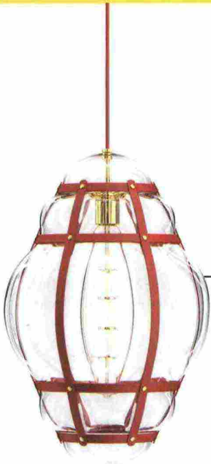
Arredi della collezione "Objets Nomades" di Louis Vuitton.

Ragnatele d'artista al Planetario, alieni e icone pop in showroom, sculture da viaggio. Il Fuorisalone dei brand