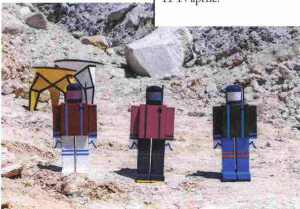
Tavolini e sculture "spaziali" da Marni.

Scultura in paglia di riso, calligrafie su tessuto, le trapuntature tradizionali delle isole Hawaii... Loewe punta lo sguardo sulle antiche tradizioni artigiane di Paesi vicini e lontani e chiama dieci artisti di tutto il mondo a realizzare una collezione di objet d'art che sarà messa in vendita durante il fuorisalone. I temi sono l'intreccio, la trama, il nodo, il materiale per interpretarli la pelle. Special guest, un maestro giapponese che darà lezioni di ikebana (con interprete). Via Monte Napoleone 21, 9-14 aprile.