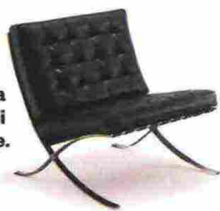
La storica "Barcelona" di Mies van der Rohe.

Il ritorno dello stile MID CENTURY e altre TENDENZE DESIGN