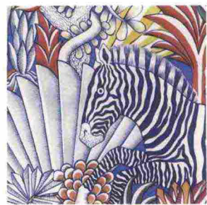
La carta da parati Hermès.

Tra gli "Animaux camouflés" di una carta da parati, la zebra di Hermès indossa un'esotica livrea bianca e blu. La maison la presenta, con le altre novità della collezione casa, alla Pelota, all'interno di un'architettura ideata da Charlotte Macaux Perelman. Via Palermo 10, 10-14 aprile.