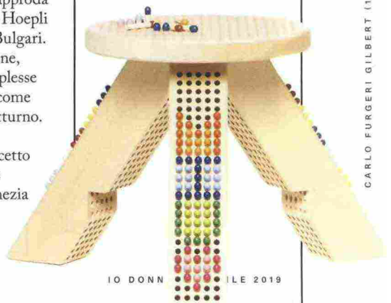
IO DONNA APRILE 2019

Lo studio di graphic design M/M (Paris) e Miu Miu l'hanno pensato per una sfilata, e adesso lo propongono in edizione limitata: il Matching Colorstool è uno sgabello personalizzabile all'infinito grazie ai 300 chiodini di colori diversi. L'allestimento al Teatro Gerolamo. Via Cesare Beccaria 34, 9-14 aprile.