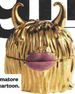
Il profumatore d'ambiente cartoon.

Le anteprime del SALONE DEL MOBILE (9-14 aprile)