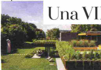
In Franciacorta, a casa dell'architetto.

Le anteprime del SALONE DEL MOBILE (9-14 aprile)